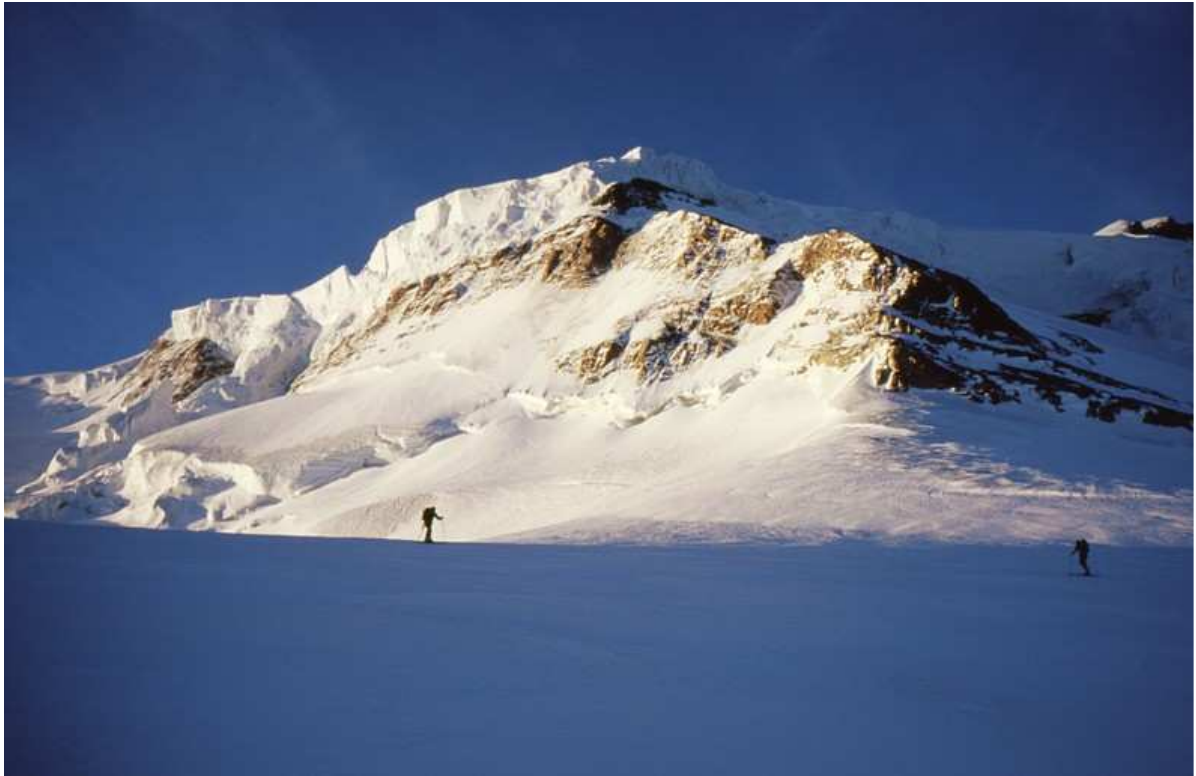
Il Plateau du Dejeuner a quota 3500 circa; il ripido pendio NordOvest è visibile in ombra, proprio sopra allo scialpinista più a destra nella foto