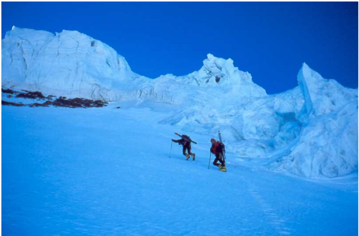
Verso l'uscita tra i seracchi