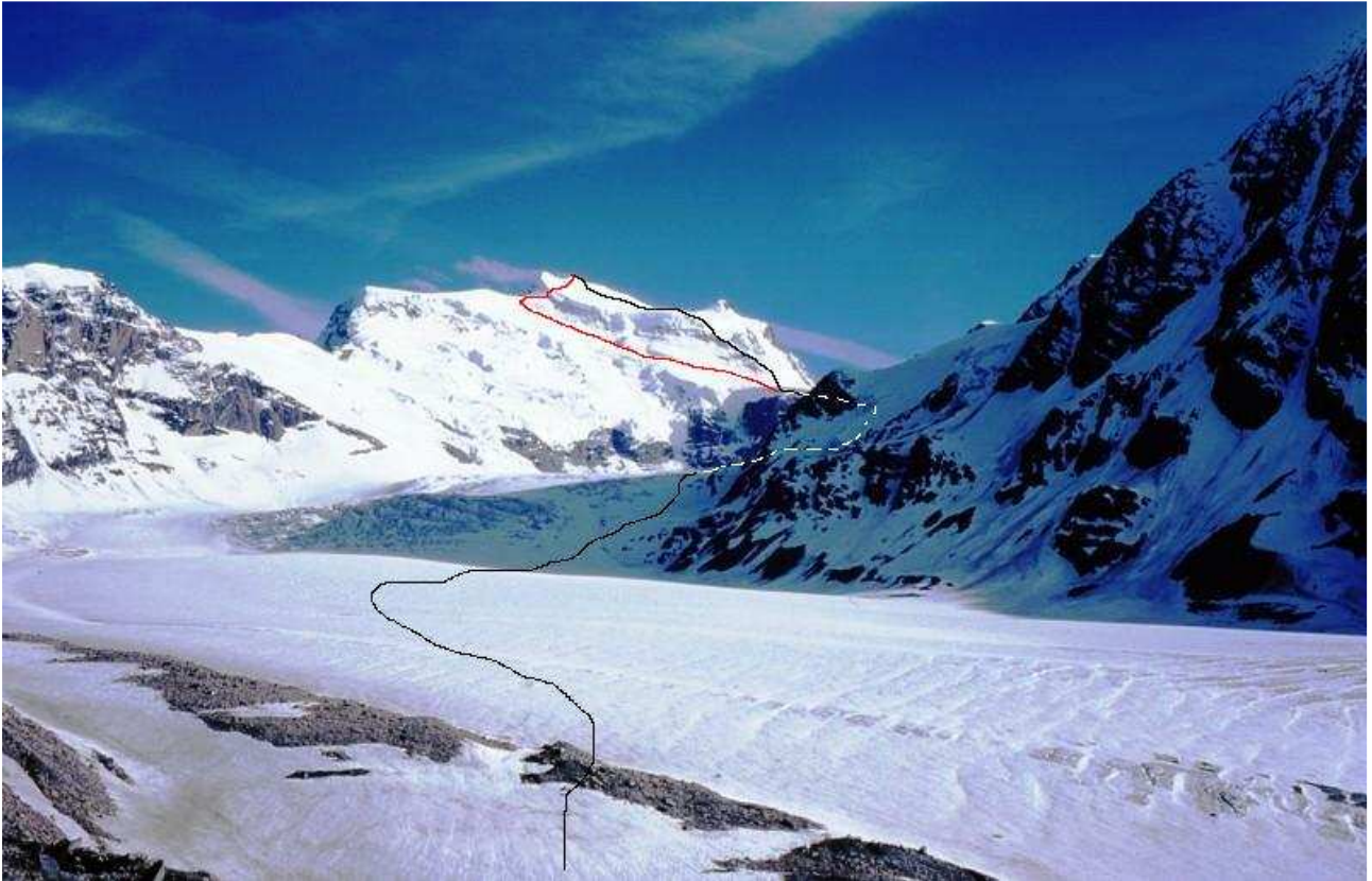
L'itinerario di salita alla cima, visto dalla Cabane de Panossiere. In rosso la via del Corridor.

Base di partenza: Fionnay (m 1490), nella valle di Bagnes, Vallese (CH) Punto di appoggio: Cabane Francois Xavier Bagnoud alla Panossiere (m 2669).