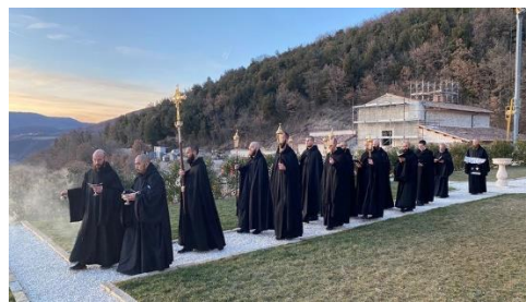
Norcia – Monast. San Benedetto in Monte